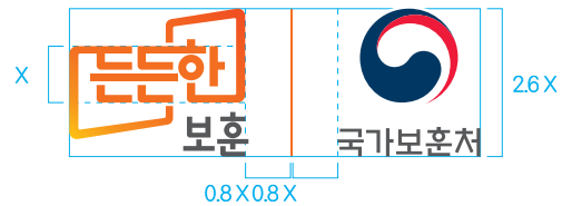
우측 정렬 (세로형)