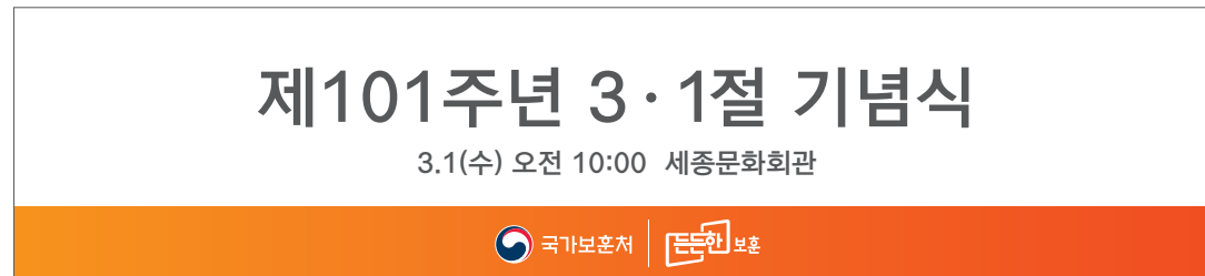
정책 브랜드 강조형